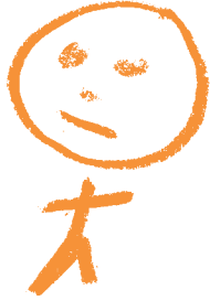
La niña que quería ser adoptada

Cuando un chaval llega a una familia en esa familia siempre hay cosas negativas y positivas.